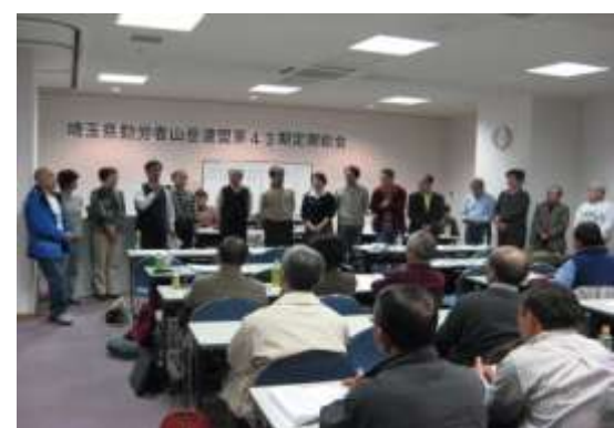
和やかに交流しました。(澤藤 記)