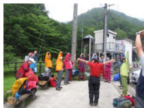
三国トンネル新潟側で

素早く雨具装着し、挨拶、ストレッチのあと3班に分かれて出発。神社のある三国峠には11時過ぎに着く。ツアー団体の登山者で神社前は混雑していた。