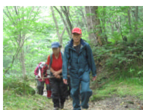
峠へは緑豊かな緩やかな道が続きます