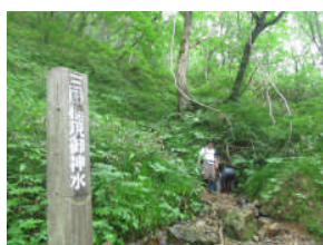
名水・三国権現御神水