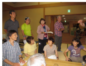
酔いもあってなんだかいい気分！