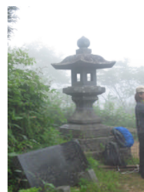
峠の石灯籠と銘石碑