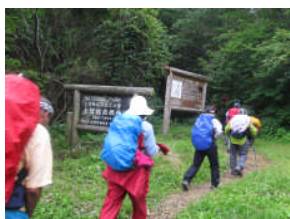
三国トンネル登山口から出発です