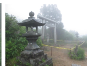
鳥居と石灯籠のある峠