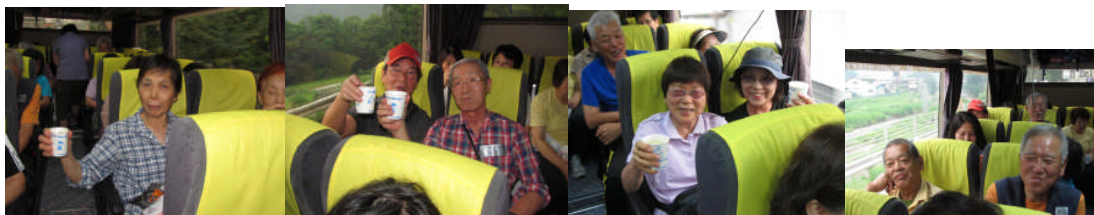
帰りのバスは楽しく和やかに交流親睦が進みます。

埼玉に着くころには、雨はすっかり上がっていた。来年の1月予定の交流ハイキングには、また参加しよう。次は何処でしょう。